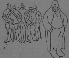
Las Naciones en coro a Giolitti, Presidente del Consejo de Italia. — «Vosotros no sabéis hacer la guerra con galantería.»

«Todos los países encuentran que hay motivo de indignación por los métodos guerreros de Italia.»