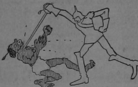
El alemán: Yo en el Cámarer me limito a acuchillarlos.